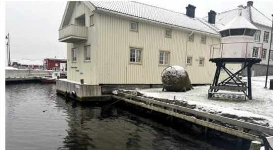
Langesundsfjordens kystlag ønsker å ta i bruk kaianten foran parken mellom Cudriogate 3 og Cudrios sjøbod til veteranbåtstøtting.